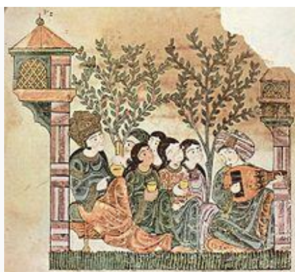
Ilustrarea Istoriei de la Bayâd i Riyâd ; manuscris maghrebian, secolul al XIII-lea

Inițial, culturile în Maghreb au fost de natură pur africană. Cu extinderea agriculturii au ajuns în Egipt influențe orientale și odată cu extinderea culturii cardiale (sau impresso - neoliticul timpuriu în zona vest-mediteraneană) și în Maghreb. În Evul Mediu acesta a fost inițial sub influență feniciană. Cartagina, cel mai mare și puternic oraș fenician se afla în Tunisia. După Războaielor Punice întreaga regiune a fost înglobată în Imperiul Roman. Cu extinderea religiei islamice în secolul al VII-lea, regiunea a intrat sub influență arabă, cu toate că până astăzi diverse minorități vorbesc limba autohtonă berberă. Influența seculară, imediat următoare, a Imperiului Otoman a durat pe toată perioada colonizării europene, în secolele al XIX-lea și al XX-lea. Granițele actuale ale țărilor membre se bazează parțial pe decizii otomane și, parțial, europene.